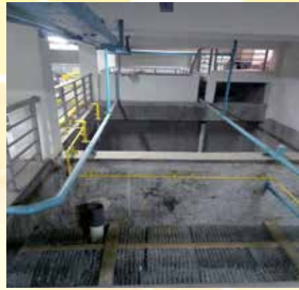
Pemasangan Honeycomb pada Bak Ipal