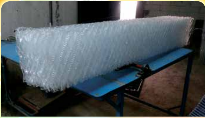
Ukuran Standar Stok Material ( 30 x 30 x P 200 Cm )