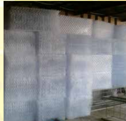
Material siap di kirim