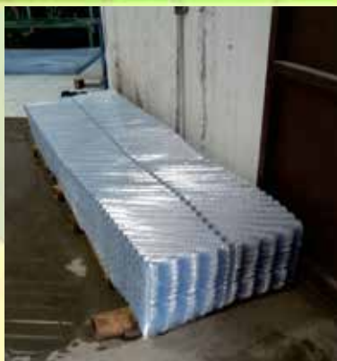
Material sesudah di Cetak