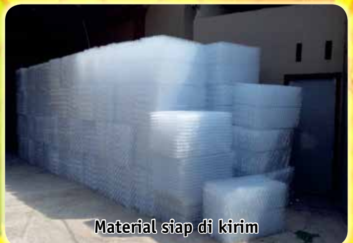
Material siap di kirim